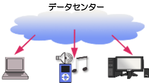
クラウドコンピューティングサービスを使用